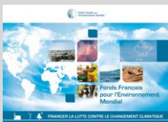
Plaquette FFEM. Changement Climatique

Le montant total des engagements pour financer le projet s'élève à près de 5 000 000 € .